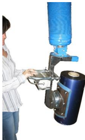
90° Drehvorrichtung Für das Aufrichten oder Ablegen von Rollen