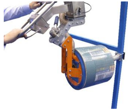
Vakuumheber für Rollen Ermöglicht das Heben und Drehen von Rollen mit einem seitlichen Greifer