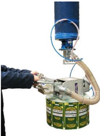
Kernheber Rollen werden mit dem Kernheber gehoben und

Die Handhabung Trommeln oder Rollen stellt meistens ein Problem dar. Sie werden oft gestapelt auf Palette angeliefert mit dem Kern in vertikaler Position. Für viele Applikationen ist eine Rotation der Rolle notwendig um sie auf einer horizontalen Spindel zu legen. Best Handling Technology bietet eine Vielzahl von Lösungen für diese Anwendungen z.B. manuelle und pneumatische Rotation und spezieller Greifer, die die Rollen in dem Kern aufnehmen.