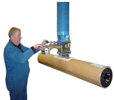
Transportieren von langen Rollen Mit angepasstem gebogenen Saugfuß