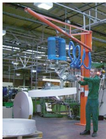
Mit Doppelschlauch Für das Heben von schwerer Rollen